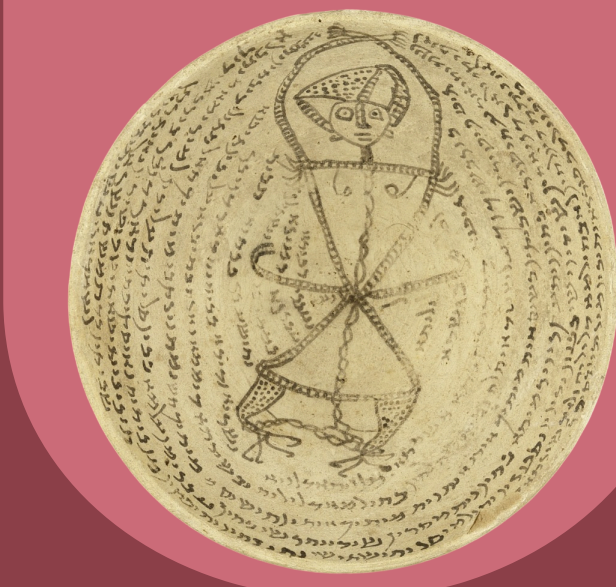
Détail de l'image d'une femme sur une coupe d'incantation babylonienne (Iraq, IV e -VII e siècle). Jérusalem, Bibliothèque nationale d'Israël.

Afin de contribuer à combler cette lacune historiographique, notre journée d'études vise à étudier le féminin dans la culture juive de l'Antiquité tardive à partir d'une analyse directe et approfondie des textes et des objets à caractère magique et médical, transmis et utilisés dans le contexte d'une tradition vivante. Dans le cadre de cette journée d'études, il est proposé de considérer le potentiel de ces documents – qui, dans leur forme actuelle, reflètent une culture en partie élitiste et « masculine » – de révéler des aspects du féminin et de la vie des femmes juives dans la période de l'Antiquité tardive (et plus généralement dans la pré-modernité). Au-delà de cette question méthodologique de fond, des cas spécifiques portant sur des textes et des amulettes juives seront également présentés, à savoir les coupes magiques babyloniennes, ainsi que des études portant sur d'autres traditions historico-culturelles, à l'instar de la tradition copte.