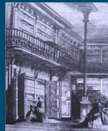
Un rituel ancien, l'ouverture de l'Armoire de fer des Archives nationales à l'Exposition universelle (gravure de Fichot, parue dans L'Illustration , 1867).