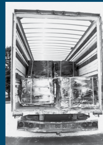
Palettes du premier camion transportant les fonds revenus de Moscou à Fontainebleau en 1994 (Archives nationales, versement 19990229).