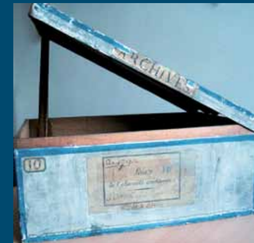
Boîte en chêne de la série A (Lois) des Archives nationales, fabriquée en 1790 (cliché Yann Potin).