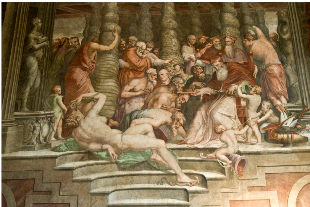
Fig. 5 : G. Vasari, Sala dei Cento giorni, Rome, Palazzo della Cancelleria