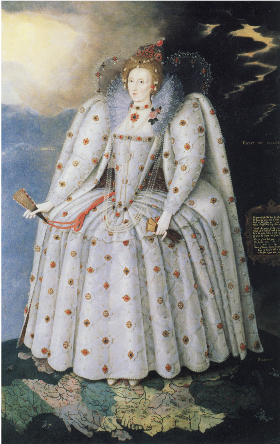
Fig. 4 : M. Gheerhaerts le Jeune, Ditchley Portrait of Elisabeth I (1592), Londres, National Portrait Gallery.