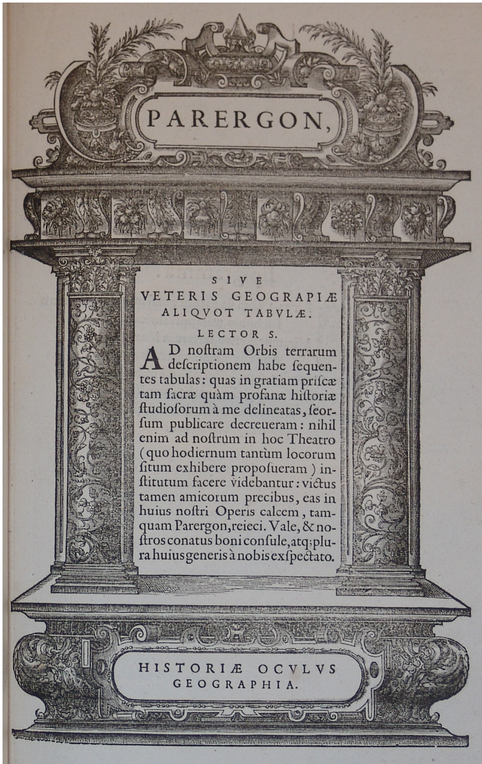
Fig. 1 : A. Ortelius, Parergon sive Veteris Geographiae aliquot tabulae , Antwerpen, Plantin, 1592.