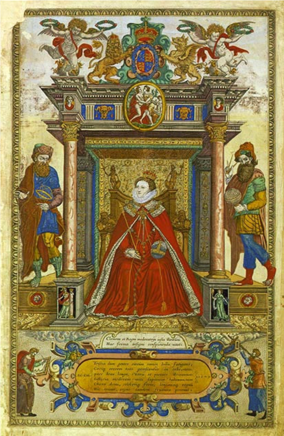
Fig. 3 : C. Saxton, Atlas of England and Wales , Londres, 1579, frontispice.